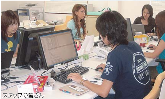
スタッフの皆さん