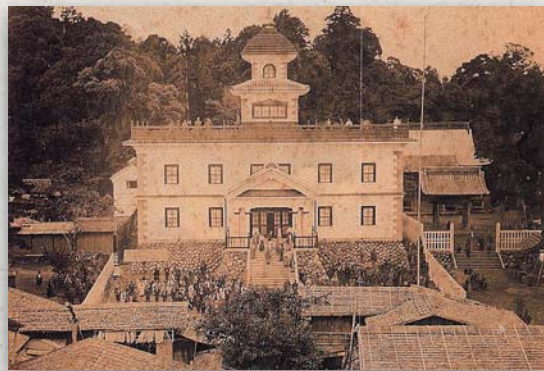
↑ 明治8年8月7日 落成・開校式の様子