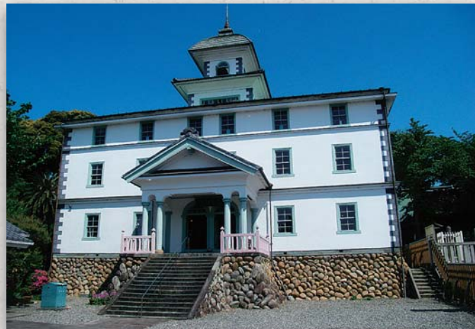
↑ 現在の旧見付学校